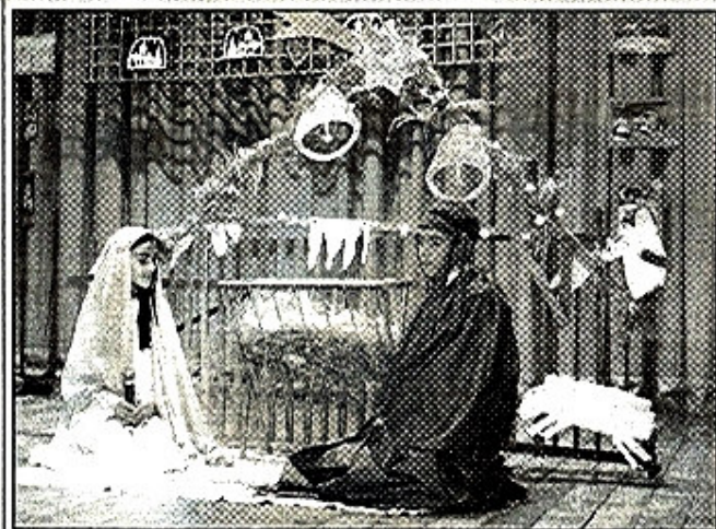
Jasličky z Vianočného programu v kultúrnom dome

Daj, Boh, šťastia tejto zemi, všetkým ľuďom v nej. Nech im slnko jasne svieti každý boží deň. Nech ich sused v láske má, nech im priazeň, pokoj dá. Daj, Boh, šťastia tejto zemi, všetkým ľuďom v nej.