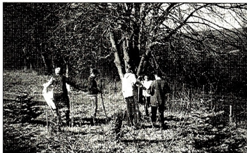
Občania Kopaníc na brigáde

Cintorín na Kopaniciach je priestorovo dosť veľký, hoci hrobov je tu menej. Ak ho chceme udržať v dôstojnom a peknom stave, podľa našich predstáv, vyžaduje si to veľa práce. Každý rok na jar, organizuje-