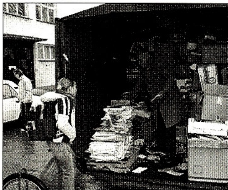
Pán škôlník vážil presne každý prinesený papier