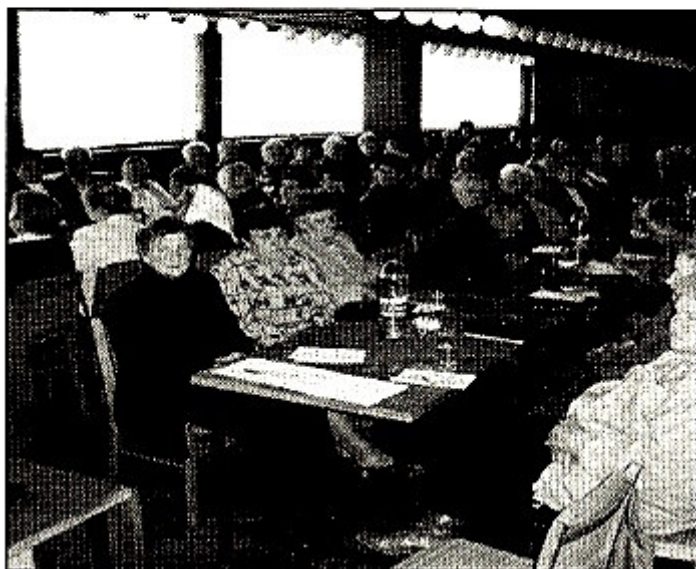
Na zakladajúcu schôdzu prišlo 67 našich dôchodcov