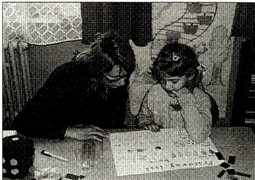
Pani učiteľka s budúcou prváčkou

Veľká udalosť tak v živote dieťaťa ako aj rodičov. Mnoho ľudí má z prvého kontaktu so školou strach a ten prenášajú na svoje deti. Často som počula názor, že v škole testujú deti. Omyl. To, čo sa deje v učebni, nie je žiadnym tajomstvom. Stretnutie s neznámou tvárou pani učiteľky je možno trochu stiesňujúce, ale pre dieťa nevyhnutné. Prijemné prostredie, priateľský prístup, to všetko je zápis do prvého ročníka. Ide o prvý kontakt dieťaťa so školou iného typu ako doteraz poznalo. Na zápise nejde o testy, ale zápis je hra. Deti sa rady hrajú.