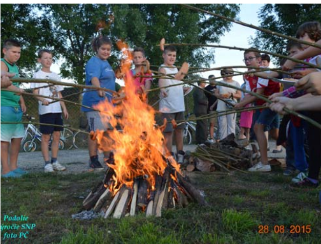
Podolie výročie SNP