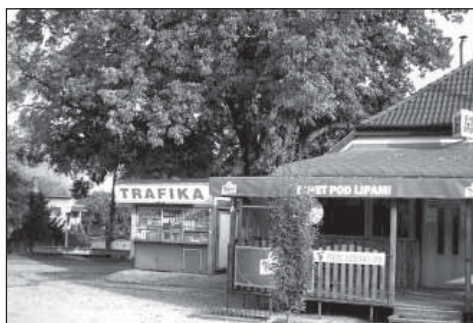
Pohľad na kaplnku z toho istého miesta a priestor v roku 2008