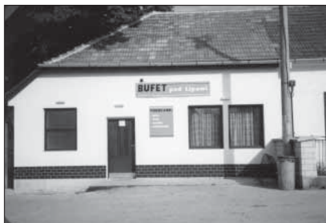
Podolie - BUFET pod lipami v rokoch 1993-1998