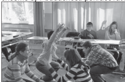
7.ročník – vyjadrenie textu piesne telom – téma Voda