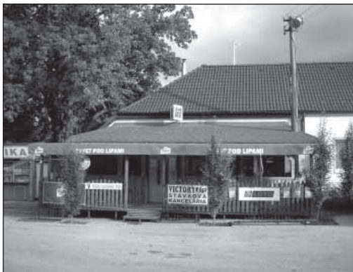
Podolie - BUFET pod lipami v rokoch 2006-2008