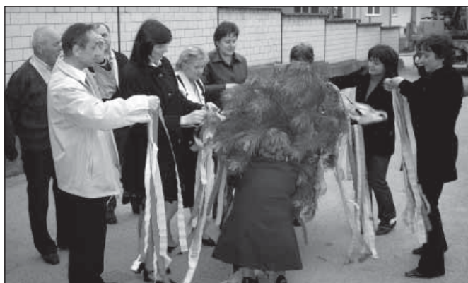
Všetci prítomní zdobili máj farebnými stužkami

tiež dychovke Podolanka, ktorá hrala do tanca i smútočného pochodu.