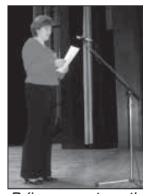
Príhovor starostky obce

Mesiac úcty k starším, to bolo motto nášho podujatia, kde sme pozvali našich jubilujúcich dôchodcov, aby sme si ich aj takto v obci uctili. Po príhovore starostky obce a pána farára, ich zabavili spevy a tance detí, mládeže i speváčok - rovesníčok. Po dobrej večeri, do spevu i do tanca, všetkým zahrála dychová hudba Podolanka. Ďakujeme všetkým účinkujúcim i tým,