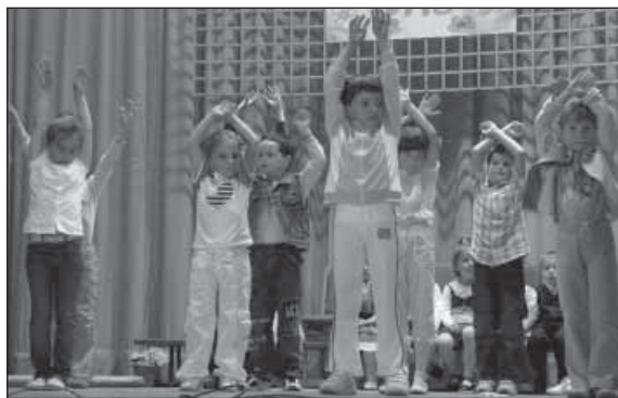
Svojim mamičkám prišli popriať i zatancovať aj prváčikovia

certné podanie prispelo veľmi k zvýšeniu kvality ich vystúpenia.