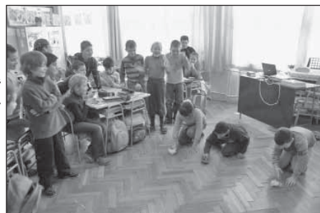
3.ročník – súťaž v skákaní papierových ropúch – téma Ropucha bradavičnatá