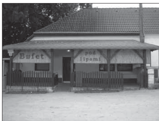
- BUFET pod lipami v rokoch 1998-2005