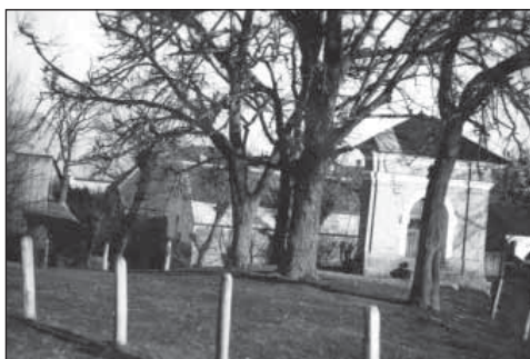
Kaplnka Panny Márie Sedembolest- nej v Podolí okolo asi v roku 1938