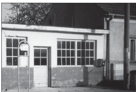
Podolie - BUFET pod lipami v rokoch 1955-1992