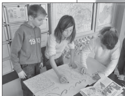
4.ročník – Tvorba plagátov – téma Starostlivosť o zdravie