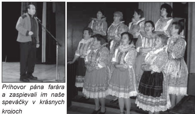
Príhovor pána farára a zaspievali im naše speváčky v krásnych krojoch