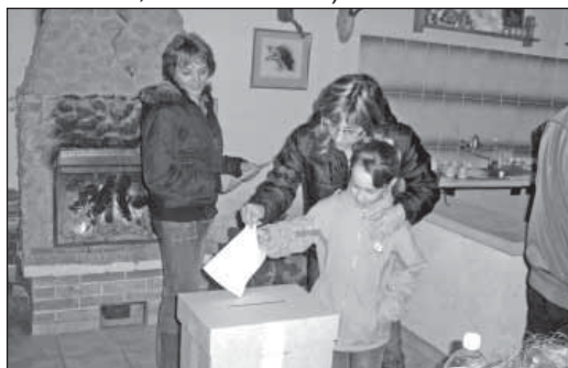
Z druhého kola volieb - okrsk 2 (kopanice)