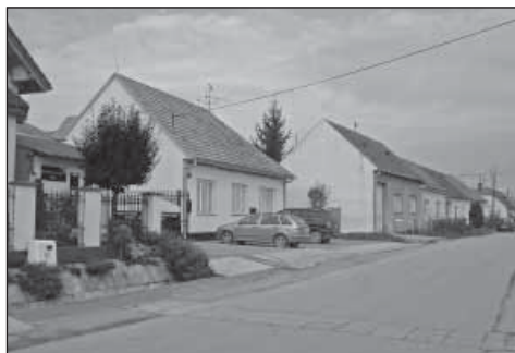
Firma GIMI v Podolí a časť ulice v roku 2008