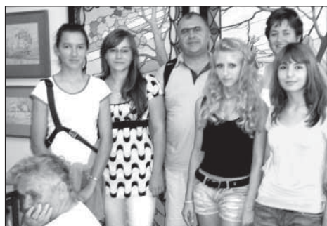
Pri návšteve rodného domu J. C. Hronského v Martine