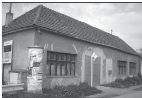
Budova bývalej školy v Korytnom, neskôr svadobka, teraz stavba slúžiaca pre výrobu