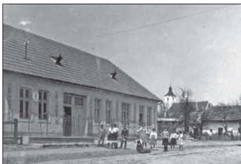
Notársky úrad v Podolí a časť ulice v roku 1938