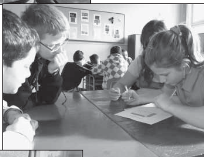
6.ročník – hra Počúvaj, počítaj, píš – téme Čas a zlomky