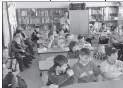
↑ Privítanie programátorov v prírodovednej učebni

Aj takýmto spôsobom sa dostáva Podolie do povedomia širšej verejnosti.