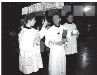
Pán farár s miništrantami a organistom

Ďakujeme všetkým divákom, ktorí sa prišli v utorok 5.2.2008 rozlúčiť s našou basou a pochovať ju na konci fašiangov. Najväčšie poďakovanie patrí našim účinkujúcim, hlavne maskám, ktoré boli vynikajúce a