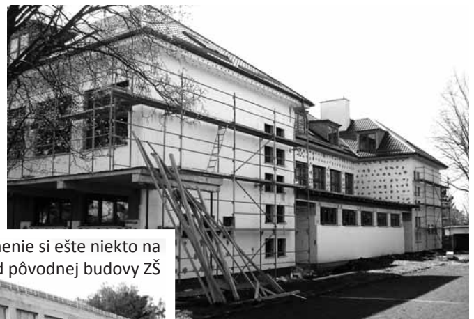
vzadu je pristavená nová šatňa