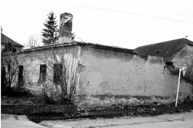
pamätáte si ešte na starý dom oproti reštaurácie