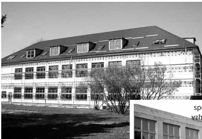
V apríli 2010 má budova ZŠ už nové podkrovie a zateplenie