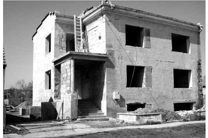
na jar 2010 ho obec pre svoje potreby prestavuje na 4 malé byty