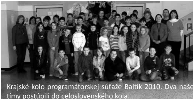
Krajské kolo programátorskej súťaže Baltík 2010. Dva naše tímy postúpili do celoslovenského kola.