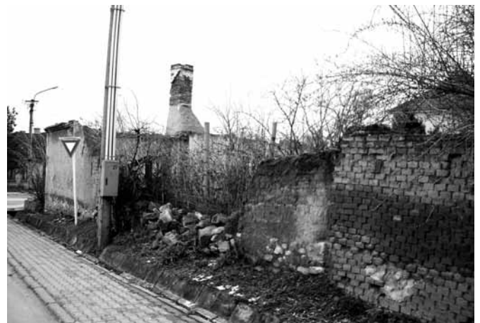
múry domu a oplotenia už padali a nekrášlili našu obec