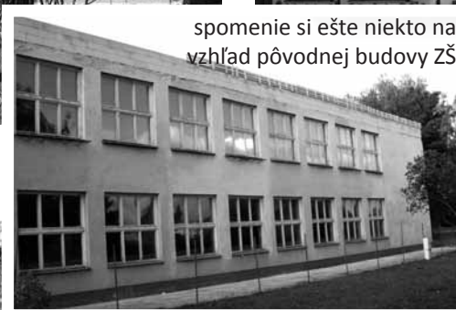
spomenie si ešte niekto na vzhľad pôvodnej budovy ZŠ