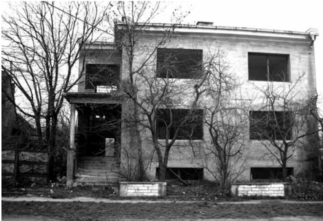
takto dlhé roky chátral dom č.s. 409 v časti Korytné