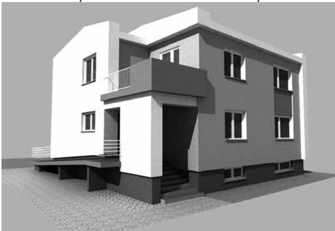
po rekonštrukcii bude dom vyzerať asi takto