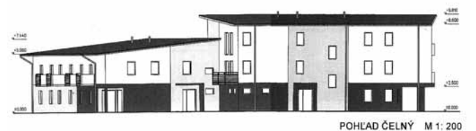
POHLAD ČELNÝ M 1: 200