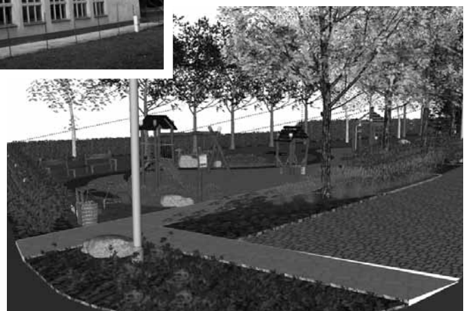
v hornej časti budú aj detské preliezky, lavičky, parčík