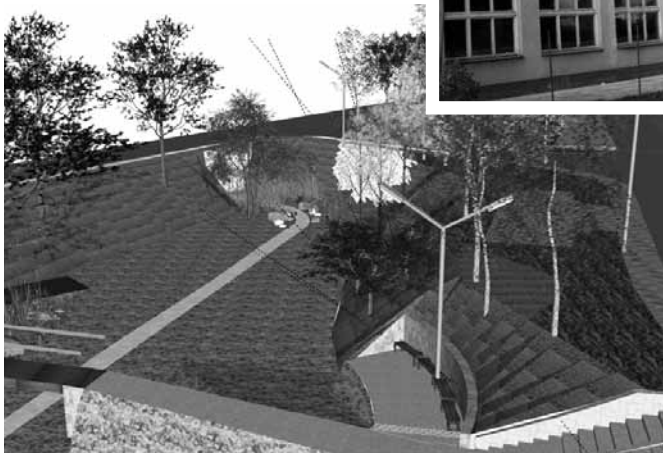
počítačová fotografia po revitalizácii pred cintorínom